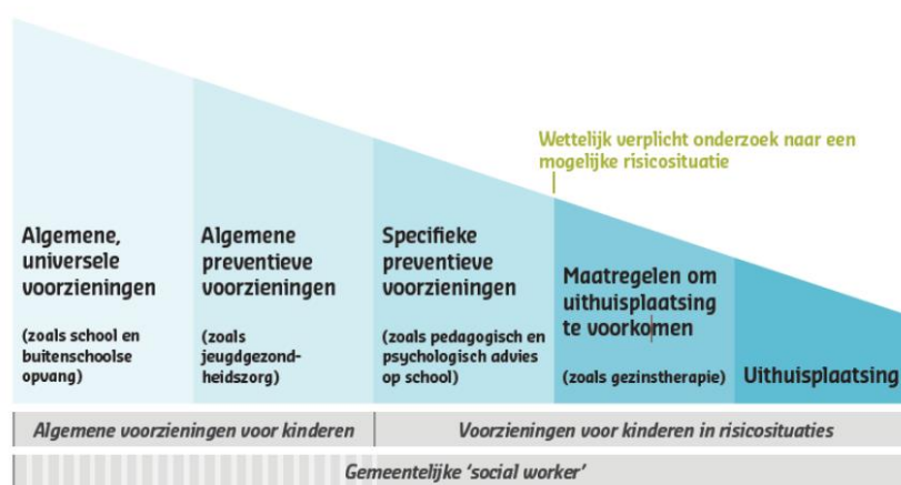
Figuur 2: Het proces van aansluiting tussen basisvoorzieningen en specialistische hulp in het Deense jeugd- en gezinssysteem

Schematisch zag het proces van aansluiting tussen basisvoorzieningen en specialistische hulp in het Deense systeem en het moment van meer specifiek onderzoek, het zogeheten §50-onderzoek, er zo uit: