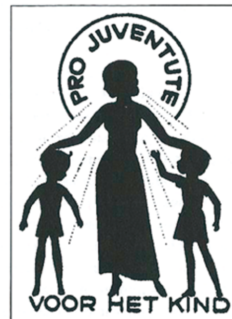
Illustratie: Oud logo Pro Juventute

Stel meer burgers aan als voogd. Dit voorstel wordt op dit moment al ingevoerd. Het zit namelijk in de methode Voogdij die dit jaar en volgend jaar wordt ingevoerd. Hierbij gaat het enerzijds om pleegouders die de voogdij krijgen over hun pleegkind en anderzijds om burgers die het gezag op zich nemen over een jeugdige die niet in een pleeggezin, althans niet in het gezin van de voogd, verblijft. Bij het ontwikkelen van de methode Voogdij bleek dat er in theorie wel steun was voor dit idee maar dat het in de praktijk nauwelijks van de grond kwam. De voogden vonden het moeilijk om geschikte zaken te vinden. Pleegouders wilden het niet want ze wilden een neutrale instantie tussen hen en de eigen ouders van het kind. Of pleegouders wilden het wel maar bureau jeugdzorg vond een neutrale buffer nodig, omdat pleegouders te weinig ruimte gaven voor het contact van het kind met de eigen ouders. Er zijn geen mensen die zich aanmelden om voogd te worden van een kind dat niet bij hen in het gezin woont. Er zijn tal van juridische, ad-