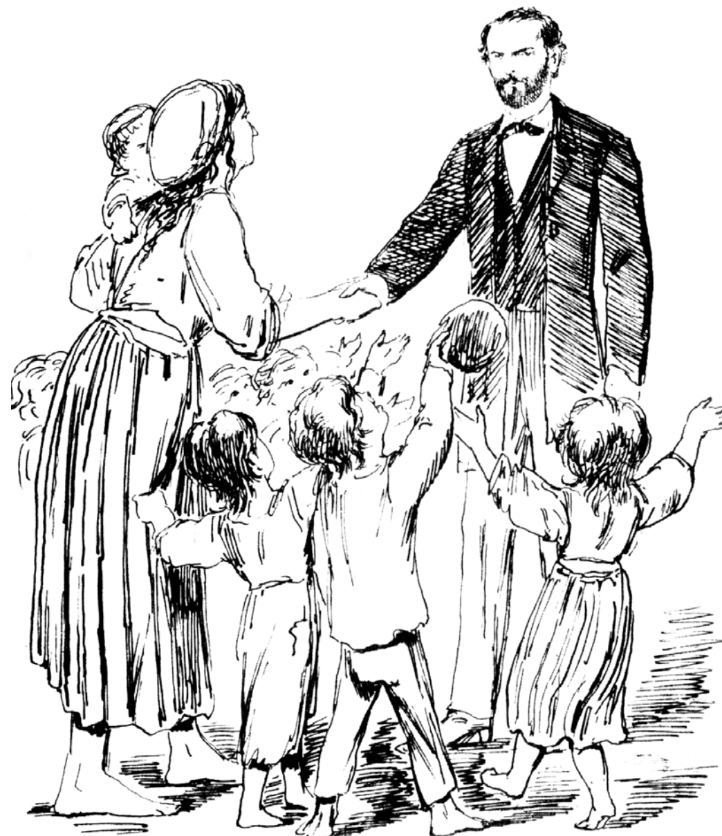
Illustratie: Kinderen bedanken Sam van Houten voor zijn kindernet - politieke prent 19 e eeuw

Anno 2012 heeft de Eigen Kracht Centrale ongeveer 700 burgercoördinatoren en er zijn meer dan voldoende burgers die zich willen aansluiten. Het aantal conferenties stijgt en het verspreidt zich naar steeds meer plaatsen in het land.