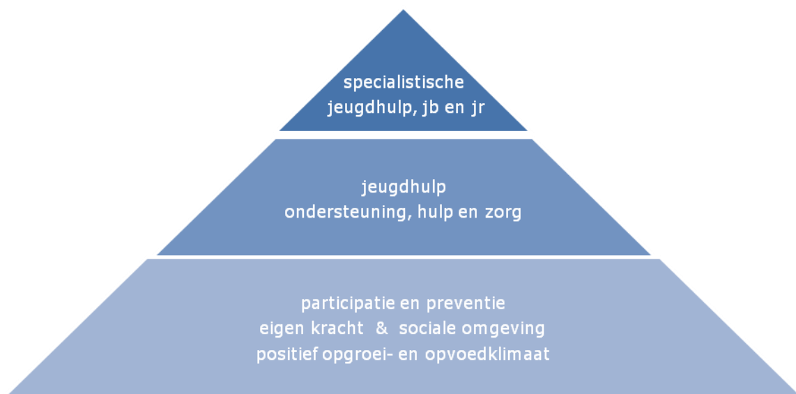
Figuur 2. Opbouw jeugdhulp, jeugdbescherming (jb) en jeugdreclassering (jr)

Figuur 2 geeft aan dat het voor het grootste gedeelte van de jeugdigen en hun ouders gaat om het bevorderen van een positief opvoed- en opgroei-klimaat, waar geen jeugdhulp nodig is. Een kleinere groep jeugdigen en hun ouders hebben ondersteuning nodig in de vorm van een voorziening. Slechts voor een zeer kleine groep jeugdigen en hun ouders is ingrijpen door de overheid noodzakelijk. Dit is het geval als ouders er onvoldoende in slagen om hun opvoedingsverantwoordelijkheid waar te maken en hun kinderen in de ontwikkeling worden bedreigd, of wanneer een jongere een strafbaar feit heeft gepleegd. Gesloten jeugdhulp, kinderschermingsmaatregelen en jeugdreclassering worden opgelegd door de rechter en uitgevoerd onder verantwoordelijkheid van en gefinancierd door de gemeenten.