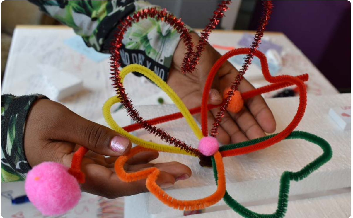
Foto 8. Aranchi (15) laat zien hoe volgens haar goede zorg eruit zou moeten zien: positieve aandacht en liefde van leiding