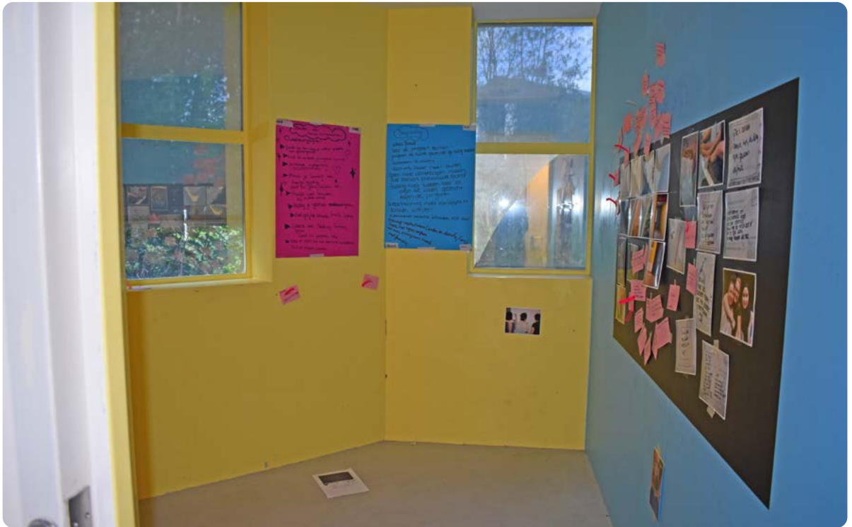
Foto 3. De isoleercel waar de meiden hun ervaringen voorlegden aan hun begeleiders