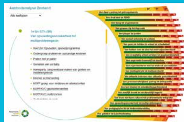
Digitale tool aanbodanalyse NB. Percentages zijn fictief.

Op basis van deze aanpak laat het NJi u als gemeente of regio zien of uw aanbod kwantitatief en kwalitatief toereikend is. Deze aanpak resulteert namelijk in een digitaal overzicht van het aantal regionaal beschikbare interventies/programma's op de verschillende vraag-/probleemgebieden, waarbij de interventies/programma's worden gerangschikt van licht naar zwaar/intensief. Dit digitale overzicht wordt aangevuld met een kort en bondig statement over de kwantiteit en kwaliteit van dit lokale/regionale aanbod. Van deze vraag/aanbodanalyse bieden we een basisvariant waarin zorg-aanbieders zelf het aanbod invoeren, en een uitgebreide versie waarbij het NJi dit doet.