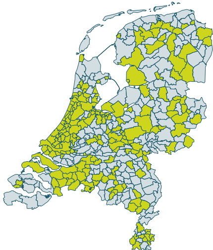
Kaart Nederland met de 127 aangesloten gemeenten (groen gemarkeerd)

Van de 127 aangesloten gemeenten die de vragenlijst van de monitor hebben ingevuld, hebben 35 gemeenten (28%) de screening van en hulp voor vrouwen in risicosituaties voor kindermishandeling in het gemeentelijk beleid opgenomen. Gemeenten met meer dan 100.000 inwoners hebben dit onderwerp vaker in hun beleidsplan opgenomen dan kleinere gemeenten. Van de gemeenten zonder gemeentelijk beleid op dit onderwerp is 54% van plan hier in de toekomst beleid op te ontwikkelen. Gemeenten met 100.000 tot 250.000 inwoners zijn minder vaak van plan om het alsnog in hun beleid op te nemen dan kleinere gemeenten. Gemeentelijk beleid heeft pas effect als de doelgroep wordt bereikt.