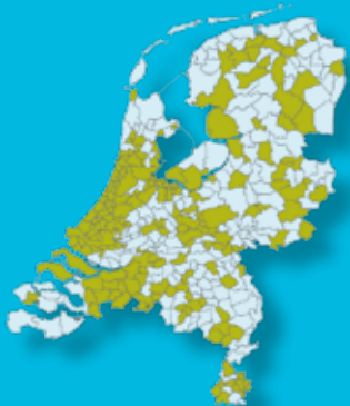
De 194 aangesloten gemeenten (groen gemarkeerd)

De monitor behandelt de tien beleidsdoelstellingen voor de preventie en aanpak van kindermishandeling die de Kinderombudsman in 2014 formuleerde. Hulp aan kinderen na huiselijk geweld is een van die doelstellingen. De monitor wordt momenteel door het NJI, samen met Movisie, uitgebreid naar het onderwerp huiselijk geweld. Begin 2016 moet de uitbreiding gereed zijn. De Bernard van Leer Foundation financiert deze uitbreiding.